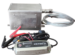
Batería ATEX con cargador de batería (enchufe europeo tipo C)