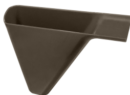
Bandeja colectora de goteo