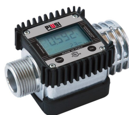
Contador de litros digital para gasolina K24 ATEX