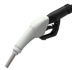
Pistola automática para AdBlue®

Para gasóleo y gasolina. Absorción de agua y filtración de impurezas. Capacidad de filtración 30µm. Caudal 70 l/min.