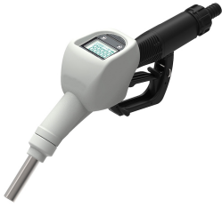
Pistola automática para AdBlue® con contador de litros integrado