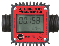
Contador de litros digital mod. M24, para gasóleo