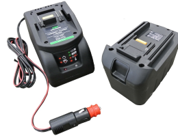
Batería de manganeso de 12V o 24V con cargador de batería (toma de mechero) y alojamiento de batería