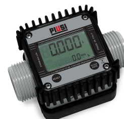
Contador de litros digital para AdBlue K24

Cuba de contención para utilizar en el suelo, con capacidad igual al 100% del volumen del tanque, realizada con acero al carbono.