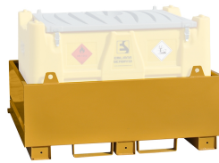
Cuba de contención para Carrytank

Cuba de contención para utilizar en el suelo, con capacidad igual al 100% del volumen del tanque, realizada con acero al carbono.