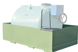
Bacino di contenimento per Bluetank

Bacino di contenimento capacità pari al 100% del volume del serbatoio, realizzato in acciaio al carbonio.