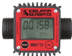
Contaltri digitale per diesel M24

Per diesel e benzina. Assorbimento acqua e filtrazione impurità. Capacità filtrante 10µm. Portata 70 lt/min