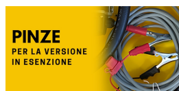
PINZE PER LA VERSIONE IN ESENZIONE