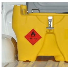
Svasature per pick-up