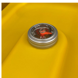
Indicatore di livello meccanico