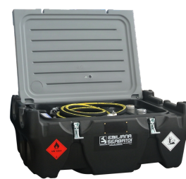
Versione benzina disponibile