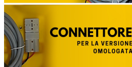
CONNETTORE PER LA VERSIONE OMOLOGATA