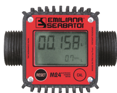
Contaltri digitale per diesel M24

Vasca di contenimento pieghevole e portatile