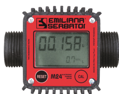
Contaltri digitale per diesel M24

Vasca di contenimento pieghevole e portatile