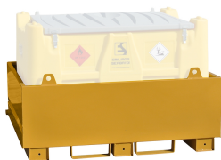
Bacino di contenimento per Carrytank®

Coperchio in polietilene integrato nella struttura e realizzato con stampaggio rotazionale.