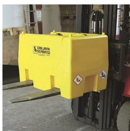
Imbocchi per sollevamento con forche