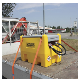
Alloggiamenti per cinghie di fissaggio