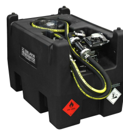
Versione benzina disponibile