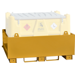
Bacino di contenimento per Carrytank®

Bacino di contenimento per uso a terra, capacità pari al 100% del volume del serbatoio, realizzato in acciaio al carbonio.