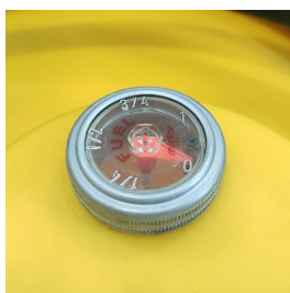
Indicatore di livello meccanico