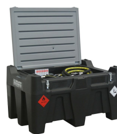
Versione benzina disponibile