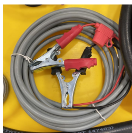
Collegamento alla batteria