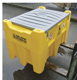
Imbocchi per sollevamento con forche