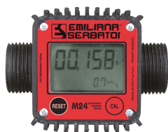
Contaltri digitale per diesel M24