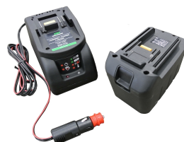
Batteria al manganese 12V con carica batt (presa accendisigari) e slot per batt.