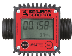
Contaltri digitale per diesel M24