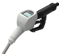
Pistola automatica per AdBlue® con contaltri integrato