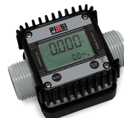
Contaltri digitale per AdBlue K24

Bacino di contenimento per uso a terra, capacità pari al 100% del volume del serbatoio, realizzato in acciaio al carbonio.