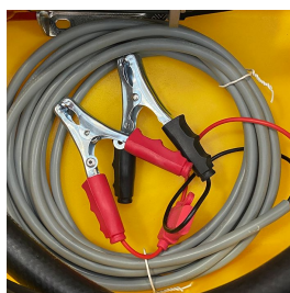
Collegamento alla batteria