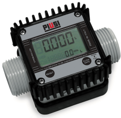
Contaltri digitale per AdBlue K24