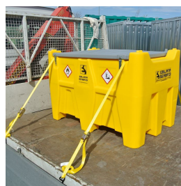
Alloggiamenti per cinghie di fissaggio