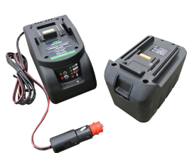
Batteria al manganese 12V con carica batt (presa accendisigari) e slot per batt.