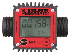
Contaltri digitale per diesel M24

Per diesel e benzina. Assorbimento acqua e filtrazione impurità. Capacità filtrante 30µm. Portata 70 lt/min