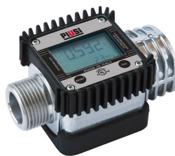
Contaltri digitale per benzina K24 ATEX

Per diesel e benzina. Assorbimento acqua e filtrazione impurità. Capacità filtrante 30µm. Portata 70 lt/min