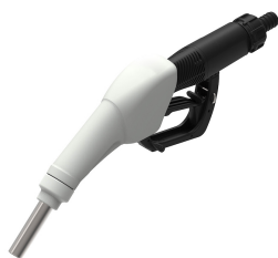
Pistola automatica per AdBlue®