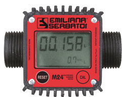
Contaltri digitale per diesel M24