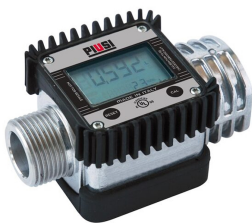
Contaltri digitale per benzina K24 ATEX