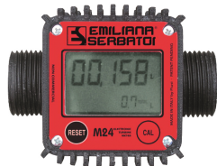
Contaltri digitale per diesel M24

Per diesel e benzina. Filtrazione impurità. Capacità filtrante 60µm. Portata 50 lt/min