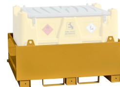
Bacino di contenimento per Carrytank®

Bacino di contenimento per uso a terra, capacità pari al 100% del volume del serbatoio, realizzato in acciaio al carbonio.