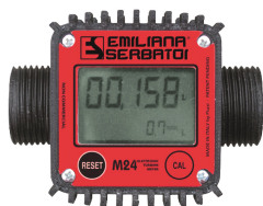
Contaltri digitale per diesel M24