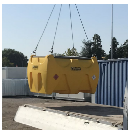
Golfari per sollevamento e fissaggio