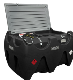
Gasoline version available