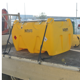
Golfari per sollevamento e fissaggio