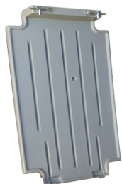
Coperchio per Carrytank® 220

Coperchio in polietilene integrato nella struttura e realizzato con stampaggio rotazionale.