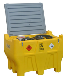
Carrytank 400+50 pick-up