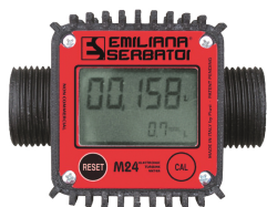
Contaltri digitale per diesel M24