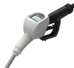
Pistola automatica per AdBlue® con contaltri integrato