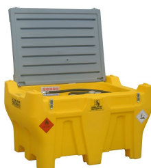
Carrytank 330 pick-up