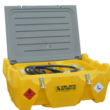
Carrytank 220 pick-up