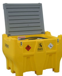
Carrytank 440 pick-up