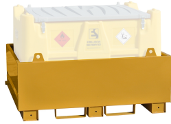
Bacino di contenimento per Carrytank®

Bacino di contenimento per uso a terra, capacità pari al 100% del volume del serbatoio, realizzato in acciaio al carbonio.