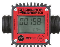
Contaltri digitale per diesel M24