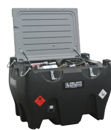
Versione benzina disponibile