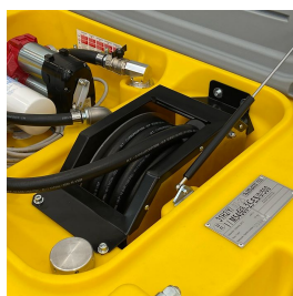
Avvolgitubo perfettamente integrato nel design del serbatoio