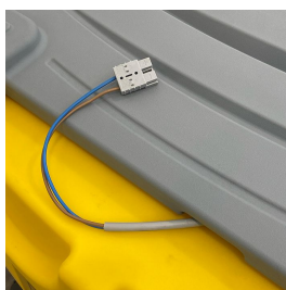
Passaggio del cavo di alimentazione possibile anche con il coperchio chiuso