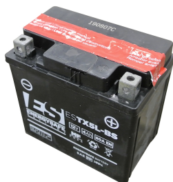
Batteria al piombo con carica batteria (presa europea tipo C)

Vasca di contenimento pieghevole e portatile