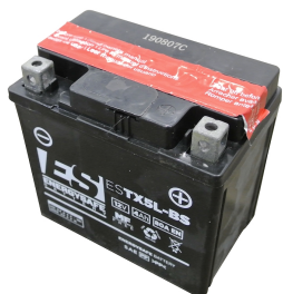
Batteria al piombo con carica batteria (presa europea tipo C)

Vasca di contenimento pieghevole e portatile