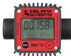
Contaltri digitale per diesel M24

Per diesel e benzina. Filtrazione impurità. Capacità filtrante 60µm. Portata 50 lt/min