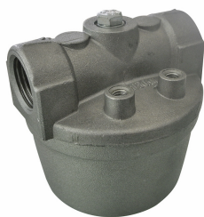
Filtro a rete in acciaio INOX

Per le connessioni di alimentazione e ritorno di gruppi elettrogeni.