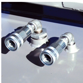
Kit di attacchi rapidi

Per le connessioni di alimentazione e ritorno di gruppi elettrogeni.