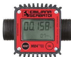
Contaltri digitale per diesel M24

Per diesel e benzina. Filtrazione impurità. Capacità filtrante 60µm. Portata 50 lt/min