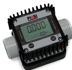
Contaltri digitale per AdBlue K24