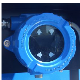
Sonda di livello DIGIMAG

Sistema di controllo remoto del livello di carburante presente nel serbatoio