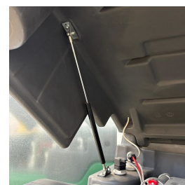
Coperchio con pistoni a gas