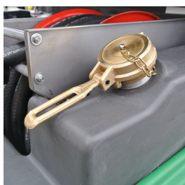
Tappo di carico da 2"