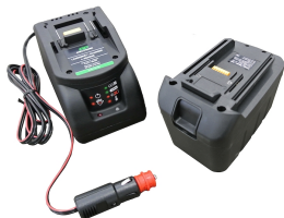
Batteria al manganese 12V con carica batt (presa accendisigari) e slot per batt.