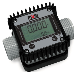
Contaltri digitale per AdBlue K24