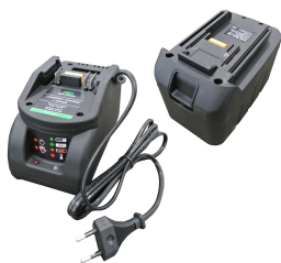
Batteria al manganese 12V con carica batt (presa europea tipo C) e slot per batt.