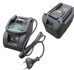
Batteria al manganese 12V con carica batt (presa europea tipo C) e slot per batt.