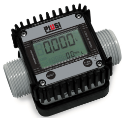
Contaltri digitale per AdBlue K24