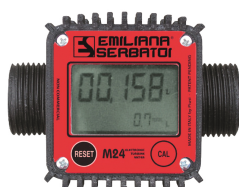
Contaltri digitale per diesel M24

Per diesel e benzina. Filtrazione impurità. Capacità filtrante 60µm. Portata 50 lt/min