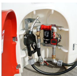
Gruppo di erogazione