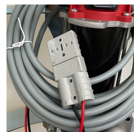
Connessione alla batteria