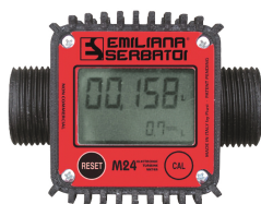
Contaltri digitale per diesel M24

Per diesel e benzina. Filtrazione impurità. Capacità filtrante 60µm. Portata 50 lt/min