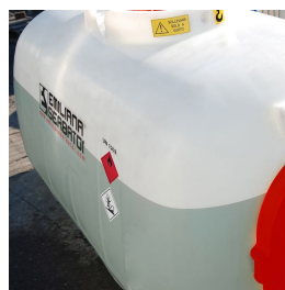
Trasparenza per monitoraggio