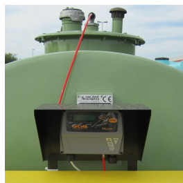
OCIO installato su Tank Fuel