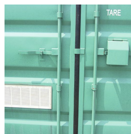
Sistema di chiusura ad aste lucchettabili