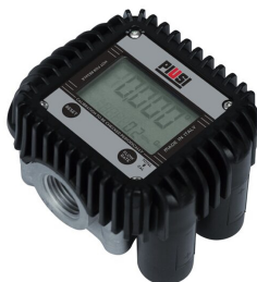
Contaltri digitale per olio