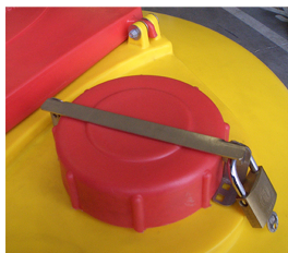
Chiusura lucchettabile Quoil

Carrello per la movimentazione, anche a pieno carico, dotato di 4 ruote girevoli, di cui 2 con freno, predisposto anche per inforcabilità con carrelli elevatori.