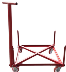
Carrello per Quoil

Carrello per la movimentazione, anche a pieno carico, dotato di 4 ruote girevoli, di cui 2 con freno, predisposto anche per inforcabilità con carrelli elevatori.