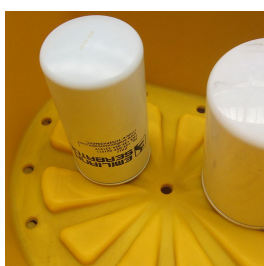
Bocca di estrazione olio