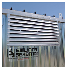
Griglia di areazione