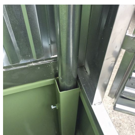
Tubolari per fissaggio nel bacino