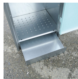
Vaschetta di raccolta estraibile