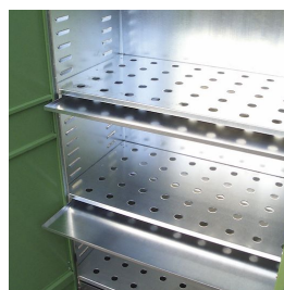
Ripiani interni in lamiera forata