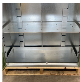
Ampia vaschetta di raccolta