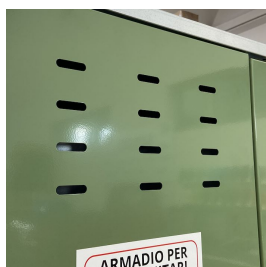
Gelose di areazione