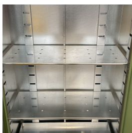
Ripiani interni riposizionabili in acciaio zincato