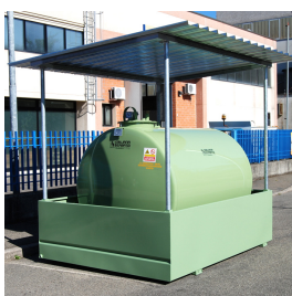
Tettoia GE Tank