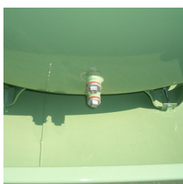
Scarico di fondo da 1" per le pulizie periodiche