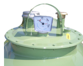
Indicatore di livello meccanico