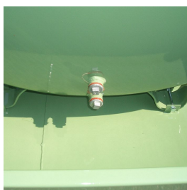
Scarico di fondo da 1" per le pulizie periodiche