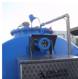
Indicatore di livello elettronico