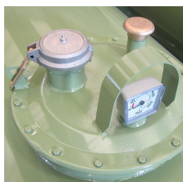
Passo d'uomo con accessori