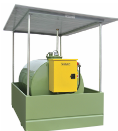
Tettoia Tank Fuel

Sistema gestionale di controllo e monitoraggio delle erogazioni di rifornimento dotato di sistema gestionale Server/Client, certificato per l'industria 4.0