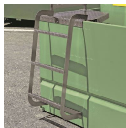
La scaletta per i serbatoi TF5D (4941 lt) e TF9 (9000 lt)