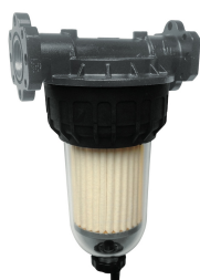
Filtro Clearcaptor 70

Per diesel e benzina. Assorbimento acqua e filtrazione impurità. Capacità filtrante 30µm. Portata 70 lt/min