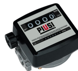
Contaltri meccanico K44