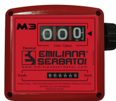
Contaltri meccanico per diesel K33

Per diesel. Assorbimento acqua e filtrazione impurità. Capacità filtrante 10µm. Portata 90 lt/min