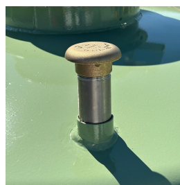
Sfiato a 240cm da terra