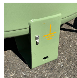
Piedi di appoggio e messa a terra