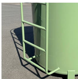
Scaletta per accesso al passo d'uomo