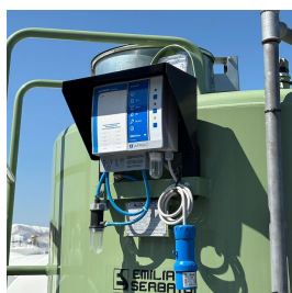
Sistema di rilevamento perdite obbligatorio