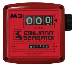
Contaltri meccanico per diesel K33

Attrezzature speciali sistemi erogazione.